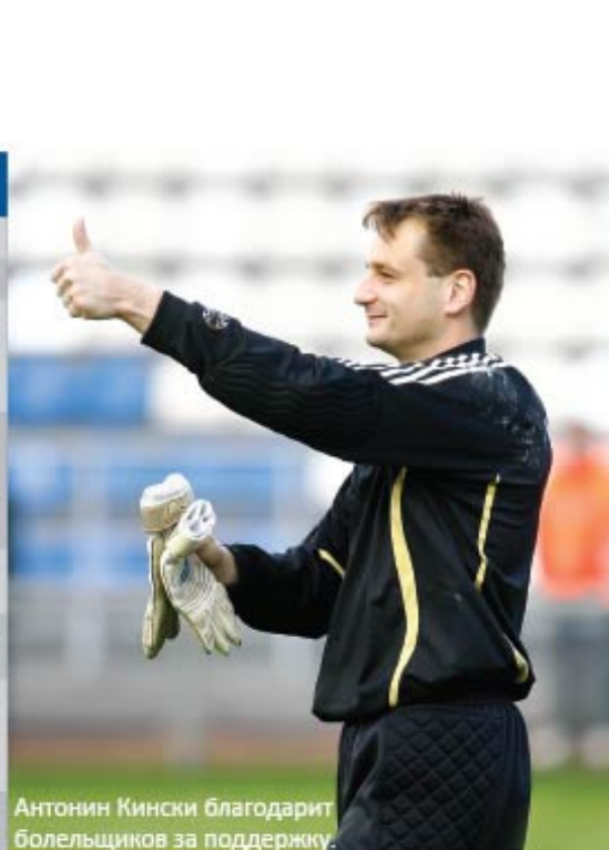
Антонин Кински благодарит болельщиков за поддержку.

18 АПРЕЛЯ. РАМЕНСКОЕ. СТАДИОН «САТУРН». 15:00. 3500 ЗРИТЕЛЕЙ.